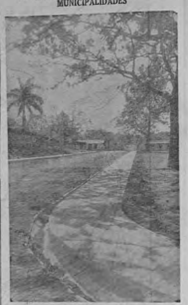
Esta obra fue construida por el INVU en Villa Colón, alrededor de la Plaza y de la Iglesia, como colaboración con la Municipalidad del lugar. El INVU presta su asistencia técnica a las municipalidades sobre toda en proyectos de urbanismo. Varios cantones disfrutan ya de sus Planos Rectores para favorecer el crecimiento de las ciudades, gracias al INVU: San Isidro de El General, etc.