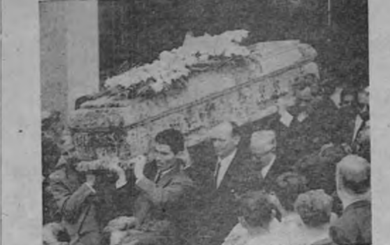
"¿Quién hallará una mujer fuerte? Ella es de mayor estima que todas las mujeres..."